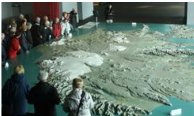
Leiðsögumaður bendir túristum á hið heimsfræga eldfjall Eyjafjallajökul á stóra Íslandslíkaninu í Ráðhúsi Reykjavíkur.