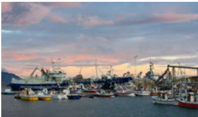
Aflaskipin Vikingur og Bjarni Ólafsson innan um smábáta í Akraneshöfn á haustkvöldi 2012.