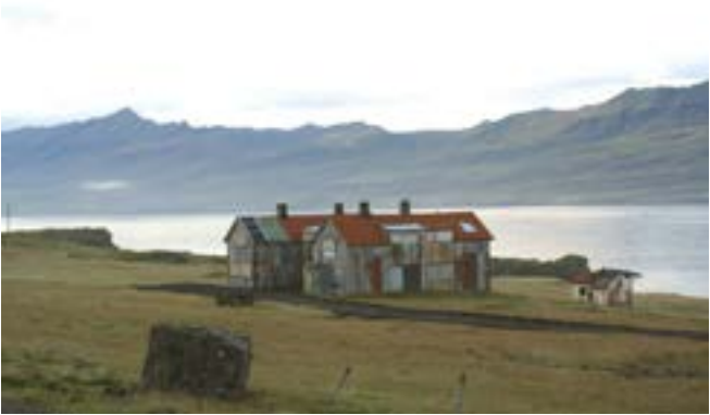
Franski spítalinn á Hafnarnesi áður en hann var fluttur.

vegar yfir að hann hygðist kæra tiltekna femínista fyrir ofsóknir og taldi að pólitískar orsakir hefðu legið að baki málatilbúnaðinum.