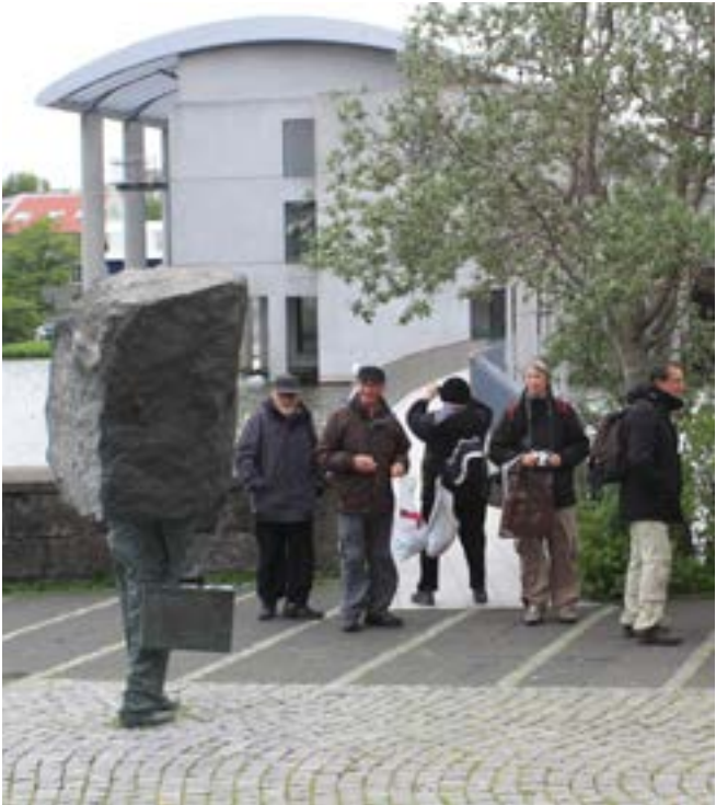
Óþekkti embættismaðurinn stefnir á Ráðhús Reykjavíkur. Túristar hafa varann á.