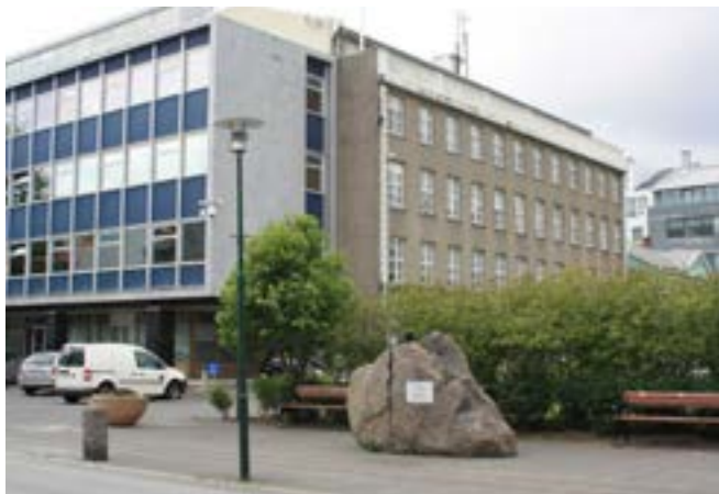
Svarta keilan, táknmynd borgaralegrar óh ýðni, fyrir framan Landsímahúsið; til hægri sést í gaflinn á gamla Kvennaskólanum (Nasa) — þrætuefni borgarbúa og skipulagsyfirvalda.

yrði haft á Austurvelli. Var því komið fyrir tímabundið beint framan við Alþingishúsið. Verkið er 180 cm hár steinn sem járnfleygur hefur verið rekinn ofan í svo að sprunga hefur myndast. Á steininum er skjöldur með tilvitnun í mannréttindayfirlýsingu franska þingsins frá 1793: „Þegar ríkisstjórn brýtur á rétti þegnanna, þá er uppreisn helgasti réttur og ófrávíkjanlegasta skylda þegnanna sem og hvers hluta þjóðarinnar.“ Ekki vakti verkið óblandna hrifningu allra og ýmsir voru óánægðir með staðsetningu þess, m.a. Alþingi sjálft. Að lokum ákváðu borgaryfirvöld að flytja það á hellulagt torg á horni Thorvaldsenstrætis og Kirkjustrætis, á suðvesturhorn Austurvallar. — En svo kaldhæðnislega vill þó til að þar stendur Svarta keilan skáhallt framan við Landsímahúsið, sem skipulagsyfirvöld borgarinnar hyggjast heimila að breytt verði í hótél, þrátt fyrir áköf mótmæli fjölmargra borgarbúa.