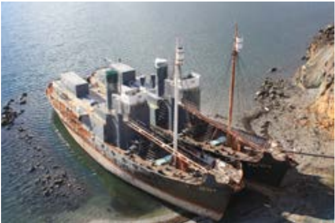
Hvalur 6 og Hvalur 7 í lokahöfn í Hvalfirði

Hvítabjörn var talinn hafa sést við Vatnsnes 4. júlí. Ítalskir ferðamenn töldu sig hafa séð dýrið á sundi og höfðu tekið af því ljósmynd, auk þess sem spor sáust í fjörusandi. Var brugðist hart við, byssumenn við Húnaflóa settir í viðbragðsstöðu og leitað vandlega, en ekkert fannst. Við nánari athugun reyndust spörin vera eftir kajakræðara.