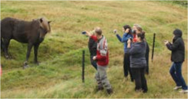
Einn vinsælasti fulltrúi íslensks landbúnaðar heilsar erlendum aðdáendum.

gjafarmiðstöð landbúnaðarins, sem er að fullu í eigu Bændasamtaka Íslands. Það fyrirtæki hóf göngu sína 1. janúar 2013 og hefur starfsstöðvar víða um land. Við þessa breytingu hættu búnaðarsamböndin, sem starfa hvert á sínu svæði, að halda úti ráðgjafarstarfi og starfsfólk sem hafði unnið að ráðgjöf í landbúnaði hjá búnaðarsamböndunum og Bændasamtökunum fluttist til hins nýstofnaða fyrirtækis.